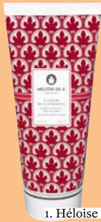
1. Héloïse de V.